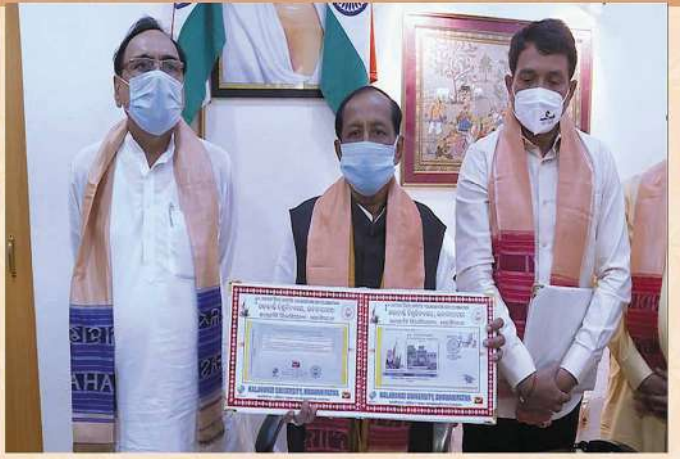
Release of Special Cover in Odisha Legislative Assembly on the eve of 1st Foundation day, of Kalahandi University