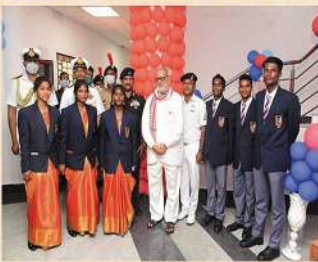
Our Cadets with His excellency Hon'ble Governor of Odisha