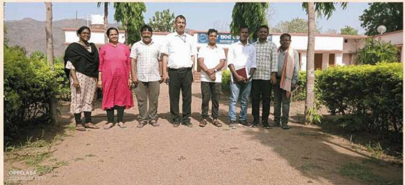
Hon'ble Vice - Chancellor with Faculty Members of Anthropology Department at Kalam School