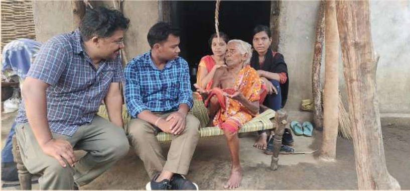
Interviewing 90 years old woman at Kalam Village