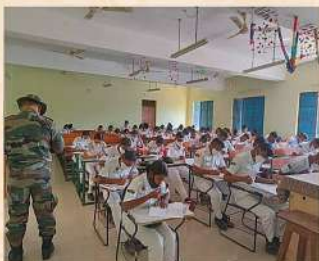
'B' & 'C' certificate exam. of 4(O) Naval unit, conducted in our University