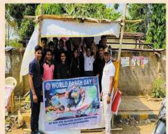
World Earth Day observed by Naval Unit