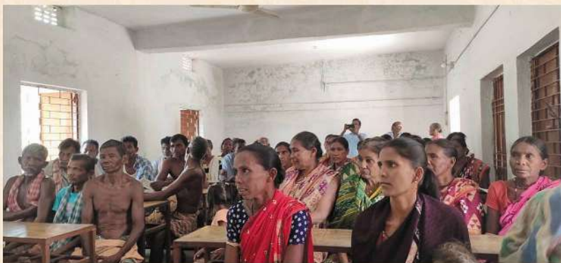
Taken Public Feedback about their different problems of the Villagers